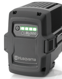
AKKU BLI300 967 07 19-01