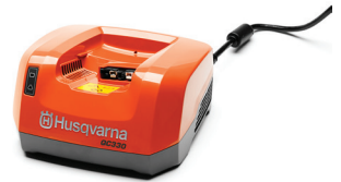
AKKU-LADEGERÄT QC330 967 09 14-06