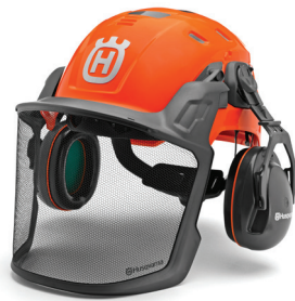
SCHUTZHELM TECHNICAL 585 05 84-01