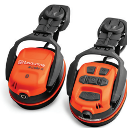
GEHÖRSCHUTZ X-COM R 595 08 42-01