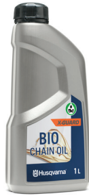
KETTENÖL BIO X-GUARD 596 45 73-01