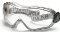
SCHUTZBRILLE, GOGGLES 544 96 39-01