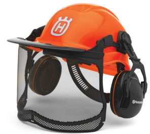
SCHUTZHELM FUNCTIONAL 576 41 24-01