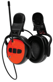
GEHÖRSCHUTZ MIT RADIO 578 27 49-04