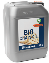
KETTENÖL BIO X-GUARD 596 45 73-03