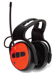
GEHÖRSCHUTZ MIT RADIO 578 27 49-03