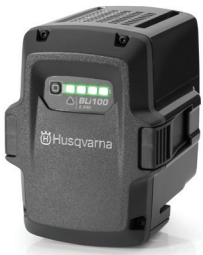
AKKU BLI100 967 09 18-01