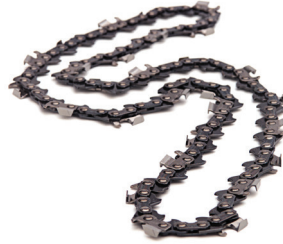
KETTE H00 1/4" HM 501 84 40-64