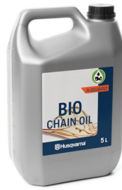
KETTENÖL BIO X-GUARD 596 45 73-02