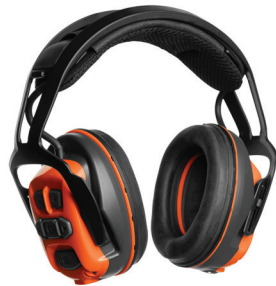
GEHÖRSCHUTZ X-COM R 595 08 40-01