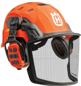
SCHUTZHELM X-COM R 595 08 43-01