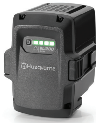
AKKU BLI200 967 09 19-01