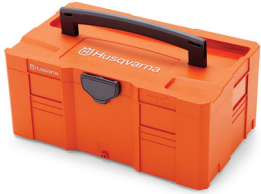
AKKU-BOX L 585 42 88-01